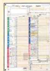
■ 確定申告書第一表(1枚)

2019年分を提出してください ※少なくとも、確定申告書第一表の控えには収受日付印が押されていること。