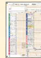
■ 確定申告書第一表(1枚)