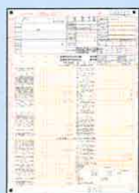
■ 確定申告書別表一(1枚)

対象月の属する月の前事業年度の分を提出してください。 ※少なくとも、確定申告書別表一の控えには収受日付印が押されていること。