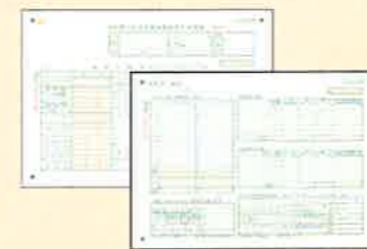
■ 所得税青色申告決算書(2枚)